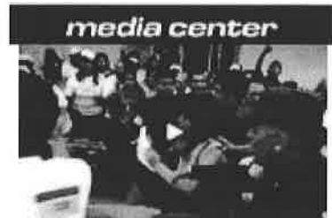
Comunidades se sienten "burladas" en Nuevo Cuscatlán

Agregaron que el policía, en vez de alertar a las autoridades y de orientarlas para dar con los hechos, se subió a un pick up de transporte público y se retiró.