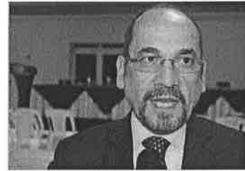
Unas seis empresas se encargarán de la transmisión de resultados a un costo de $6.5 millones.