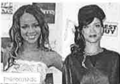
Celebridades acusadas de blanquearse la piel Lossip Español