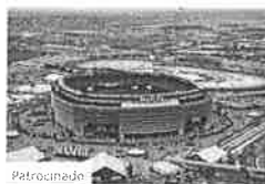
Estadios de lujo para el deporte más popular de los Estados Unidos La Voz Daily