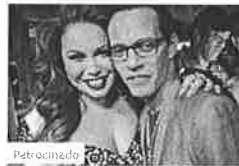
Besos, selfies y sonrisas... ¡mira sus 'twilpics' más divertidas! Univision