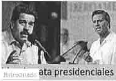
Metidas de pata presidenciales Lossip Español