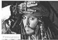
Famosos que no se bañan Lossip Español