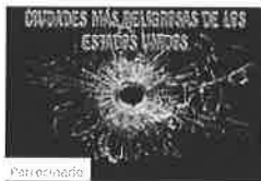
Ciudades más peligrosas de los Estados Unidos Lossip Español